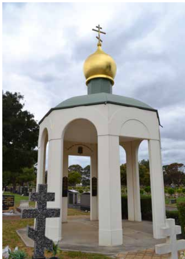
Часовня на кладбище Дадли Парк