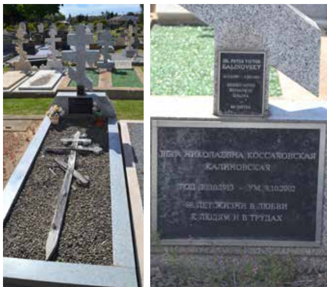
По документам на фамилию Калиновский он был 1907 г. р. Это было сделано специально, чтобы снизить возраст для въезда в Австралию или другую возможную страну иммиграции

Но, будучи практикующим хирургом и большим учёным, он всё же остался маленьким мальчиком, рано потерявшим опору в лице своего отца и навсегда расставшимся с матерью, без какой бы то ни было возможности общаться с ней и знать, жива ли она. Десятилетия спустя, в 1977 году, преодолевая страх разоблачения, посетил Родину, чтобы увидеть первую жену и дочь, встретиться с ними, навестить могилу матери.