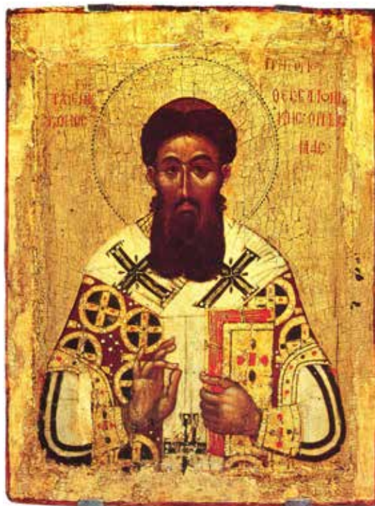
Святитель Григорий Палама

В субботу на пятой неделе совершается «Похвала Пресвятой Богородице»: читается великий акафист Богородице. Эта служба установлена в Греции в благодарность Богородице за неоднократное избавление Ею Царьграда от врагов. В пятое воскресенье Великого Поста совершается последование преподобной Марии Египетской.