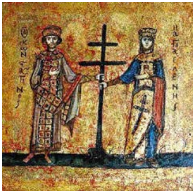
Равноапостольные Константин и Елена. Храм Святой Софии, Константинополь

Самый распространенный сюжет иконы Воздвижения Креста Господня сложился в русской иконописи в XV-XVI веках. Иконописец изображает большое скопление людей на фоне одноглавого храма. В центре на амвоне стоит Патриарх с поднятым над головой Крестом. Под руки его поддерживают диаконы. Крест украшен веточками растений. На первом плане – святители и все, кто пришел поклониться святыне. Справа – фигуры царя Константина и царицы Елены.