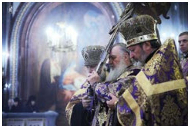
Воздвижение Креста Господня. Храм Христа Спасителя, 2011

Чин Воздвижения Креста является неотъемлемой частью богослужения праздника Крестовоздвижения. Об этом говорит, в частности, разнообразие в описаниях чина в тех или иных памятниках: одни описывают как чин совершается при служении Патриарха с сонмом духовенства, другие – лишь священника с диаконом. В частности, в ответ на вопрос епископа Сарайского Феоноста