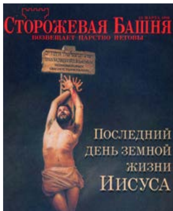
Обложка журнала Свидетелей Иеговы

Но ты всё-таки хотел бы свидетельствовать из самого Священного Писания от непосредственных свидетелей распятия? Давай внимательно прочтём слова апостола и евангелиста Матфея: «И поставили над головою Его надпись, означающую вину Его: Сей есть Иисус, Царь Иудейский» (Мф. 27:37). Представь себе человека, распятого на столбе, с руками, привязанными или прибитыми над головой – где в этом случае должна была бы быть табличка – над головой (как засвидетельствовано у евангелиста) или