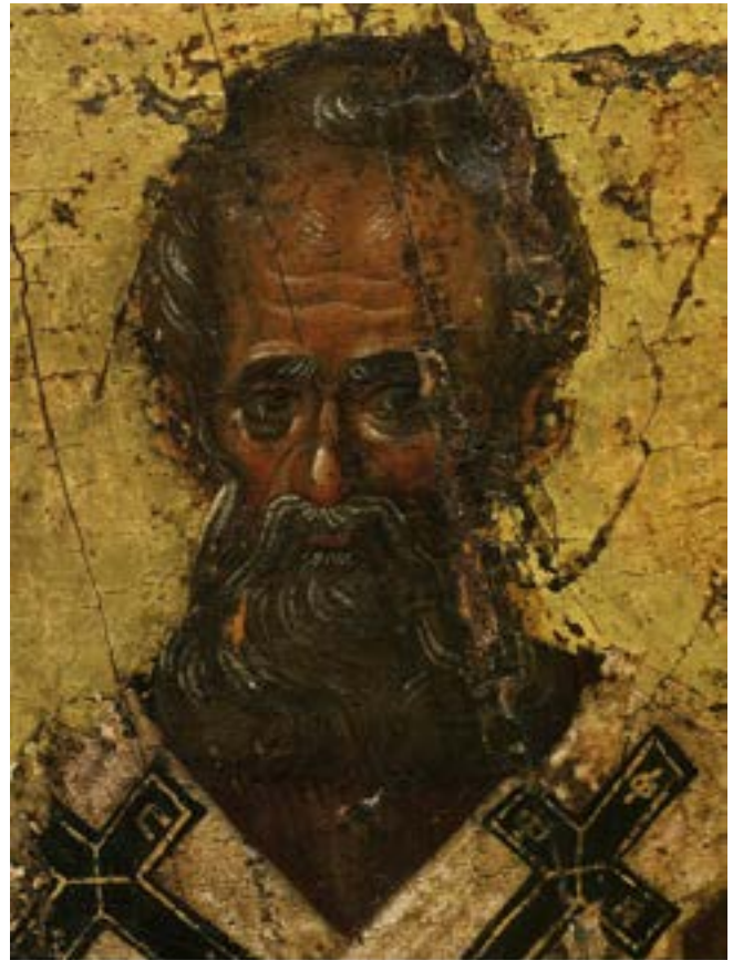
Святитель Григорий Богослов, фрагмент иконы «Три Святителя» в монастыре Ватопед на Афоне

«А теперь почти чревоношение, и скажи, если не как Иоанн во чреве, то как Давид при упокоении Киота; уважь перепись, по которой и ты вписан на небесах; поклоняйся Рождеству, через которое освободился ты от уз рождения [т.е. от уз первородного греха. – Прим. ред.]; воздай честь малому Вифлеему, который опять привёл тебя к Раю; преклонись перед яслями, через которые ты, сделавшийся бессловесным, воспитан Словом. Познай (повелевает тебе