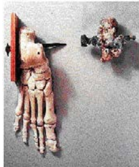
Останки гробницы Гив'ат ха-Мивтар

Вот так и в нашем случае, Свидетель. Если