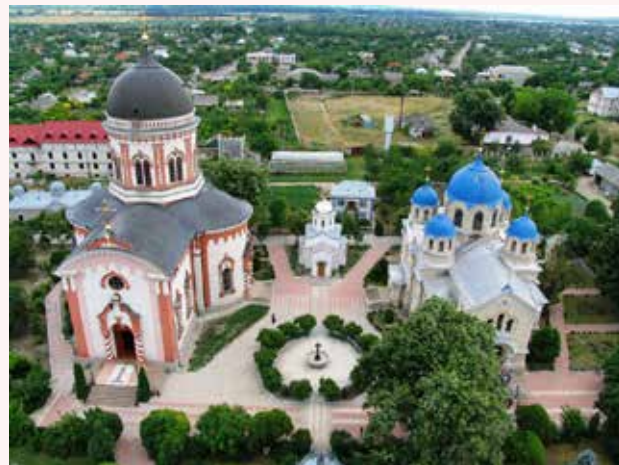
*Свято-Вознесенский Ново-Няецкий (Кицканский) монастырь – православный мужской монастырь в приднестровском селе Кицканы на правом берегу Днестра в 6 км южнее Тирасполя. Монастырь относится к Молдавской митрополии Русской Православной Церкви.

Кто не знает, как безотраднa и тяжела жизнь сирот! Всевозможные приюты, школы и учебные заведения наполнены ими, но есть