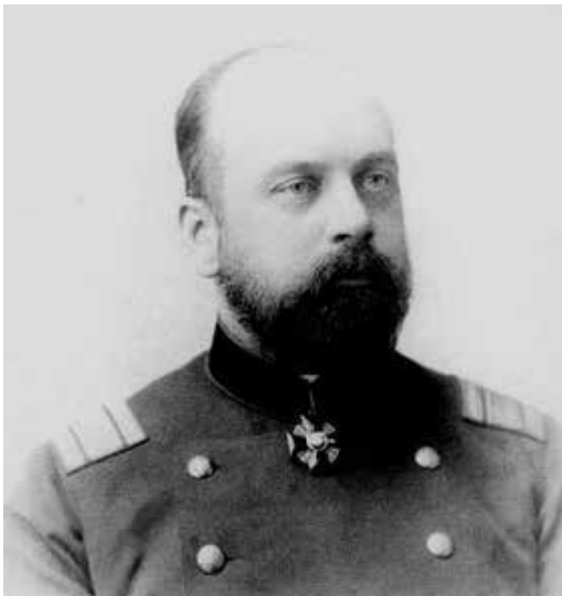
Л.М. Чичагов. Начало 1890-х гг.

другим человеком. В поисках ответа на вопрос: «Как жить по-Божьему, по-христиански», он пришёл к выдающемуся духовному наставнику – отцу Иоанну Сергиеву (о. Иоанн Кронштадтский). Беседа с кронштадтским пастырем произвела на него настолько сильное впечатление, что с того времени все жизненно-важные решения Леонид Чичагов принимал лишь по его благословению.