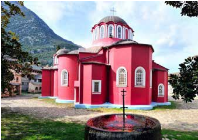
Благовещенский храм в Великой Лавре

как место его подвигов. Однако находящаяся в глуби лесов обитель Ксилургу более исторически обоснована, хотя сравнительная близость к ней пути, ведущего через Ватопед в Эсфигмен только подчеркивает реальное подвизание прп. Антония в этих местах.