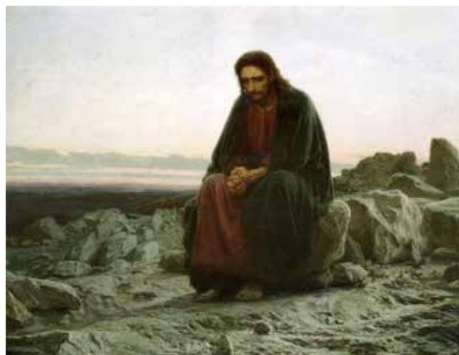
И.Н. Крамской «Христос в пустыне»

Держа пост в среду и пятницу, следует не просто соблюдать диетические или иные аскетические предписания, но прежде всего готовить себя к противостоянию внутренним и внешним искушениям. То есть мы должны, во-первых, подготовиться к тому, чтобы оказаться сильнее тех искушений, перед которыми не устоял Иуда, чтобы нам не отпасть от учеников Христа, как отпал он. А во-вторых, оставшись с Христом, мы должны быть готовы претерпеть любые внешние искушения со стороны других людей и разделить с Ним даже те крестные