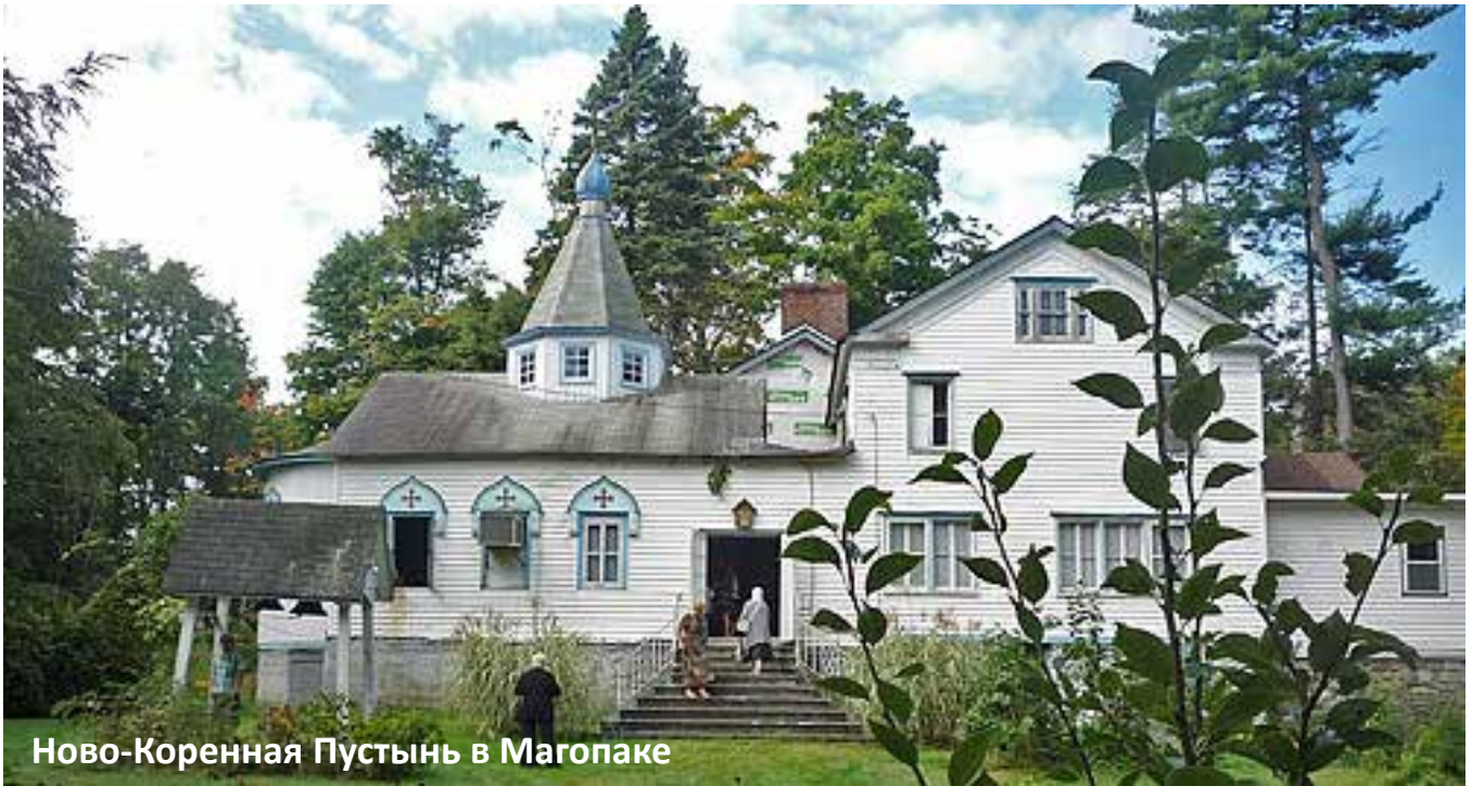
Ново-Коренная Пустынь в Магопаке

истинным «приятелем сирых, странников предстательницей, благой утешительницей всех, прибегающих к ней с усердием и верою». Много чудес свершилось в это время от Чудотворного образа Божией Матери.