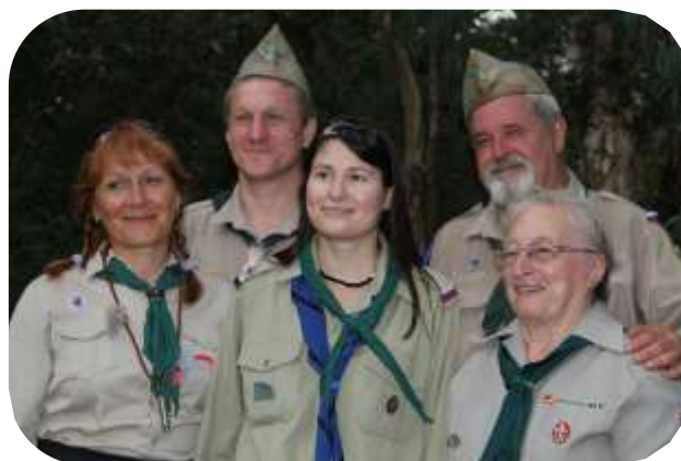
Руководители Аделаидской Дружины

По количеству ребят лагерь был чуть меньше, чем в прошлом году (аделаидцев было больше, чем обычно), но зато лагерь прошёл более организованно. Причём важно то, что эту организованность обеспечили сами ребята: и старшие разведчики, и витязи с дружинницами (это помощники руководителей, прошедшие разведческую лестницу не менее чем на 2 разряд, и показавшие себя хорошими лидерами, а также давшие особое Обещание витязей) – за помощь им большое спасибо! В этом лагере