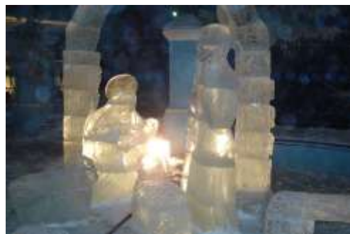
Рождественские ледяные фигуры у Казанского Храма в Тельме

Богослужения в нём совершаются регулярно, согласно расписанию, а реставрационные и восстановительные работы продолжаются. Строится также большое здание духовно-просветительского центра, где разместятся Воскресная школа, актовый зал, различные мастерские для ребяташек, библиотека, спортивные секции, бассейн, трапезная и многое дру-